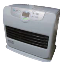
石油ファンヒーター

入らない → 粗大ごみ戸別収集か、直接搬入 [下記、こんなときどうする？のQ1.へ]